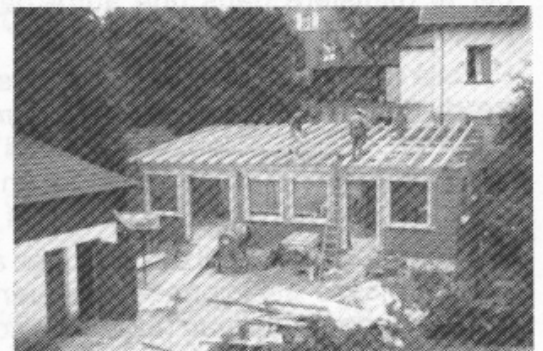
Construction de la Salle Paroissiale en 1979